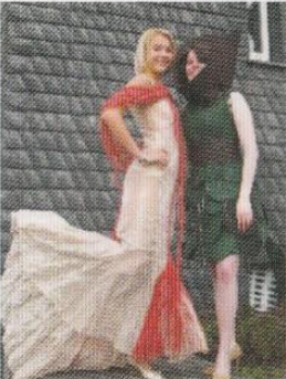
Tradewinds Style Award